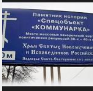
Komunarka, place of mass-murder by communists